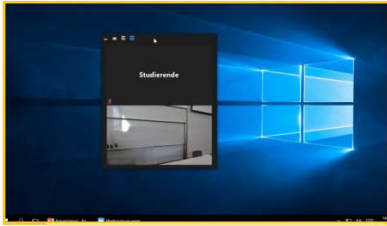
9 Externe Teilnehmer*innen auf zweiten Bildschirm verschieben