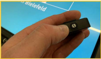
4 Mikrophon und Empfänger einschalten (Taste 3 Sek. gedrückt halten)