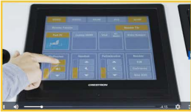
2 Medienton einschalten und anpassen