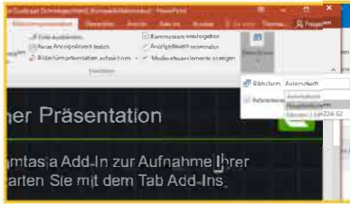
12 Powerpoint anpassen: Präsentation auf Hauptbildschirm (nur bei 2tem Bildschirm!)