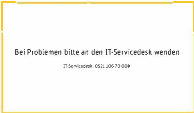
15 Support über IT-ServiceDesk (Telefon im Raum, Nr. -70000)