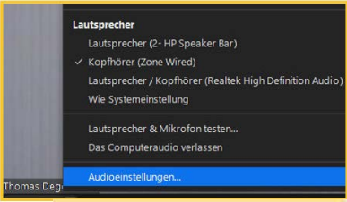
7 Audioeinstellungen aufrufen