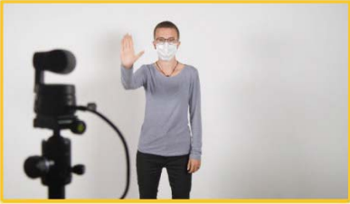
10 An Kamera mit Geste anmelden