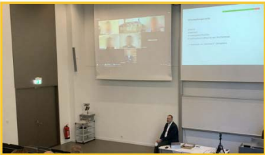
13 Veranstaltung durchführen