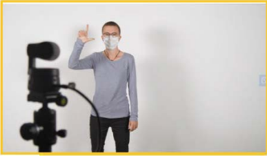
11 Geste zum Zoomen