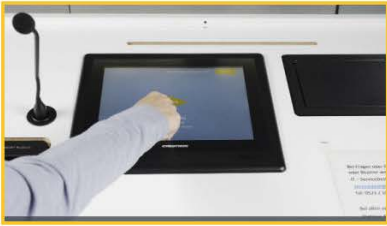
1 Anlage starten