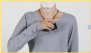
5 Mikrofonsender anlegen